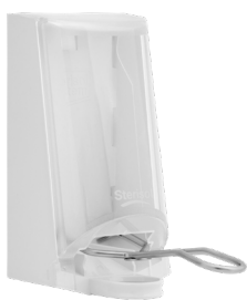
Art. nr. 4567