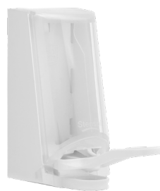
Art. nr. 4547