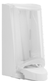
Art. nr. 4551