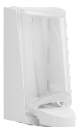
Art nr 4551