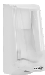
Art nr 4546