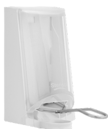
Art nr 4567